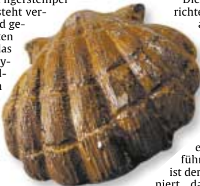
Die Jakobsmuschel als Wegweiser

Zum Andenken an dieses tierische Wunder werden noch heute in der Kathedrale in Santo Domingo de la Calzada ein Hahn und eine Henne in einer Mauernische gehalten. Gegenüber hängt ein Stück Holz vom Galgen. In der spanischen Partnerstadt von Winnenden nämlich soll sich einst dieses Wunder ereignet haben.